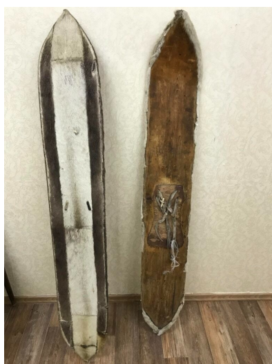
Сухиллал (камусные лыжи)