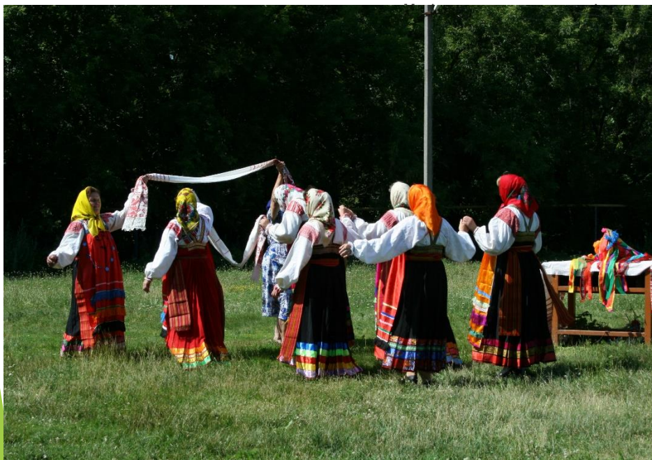
Хороводы с ширинкой (полотенцем) Белгородская область