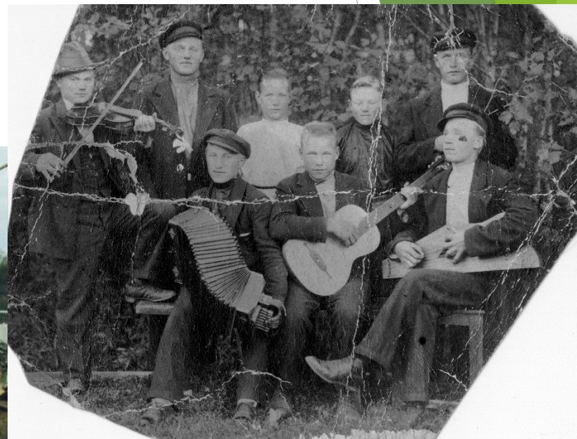
Народные музыканты. Псковская область