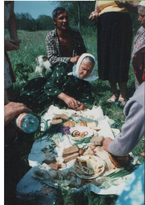
Поминки в поле после обрядовых похорон кукушки. Калужская область