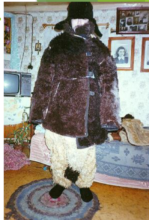
Святки. Ряженный медведем. Псковская область