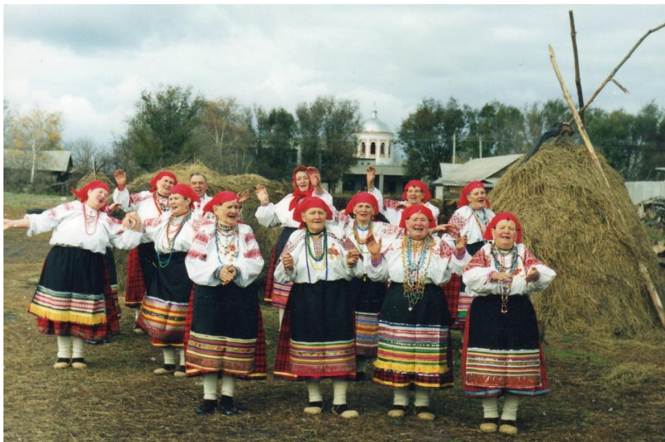
Троица в селе Россошь. Воронежская область