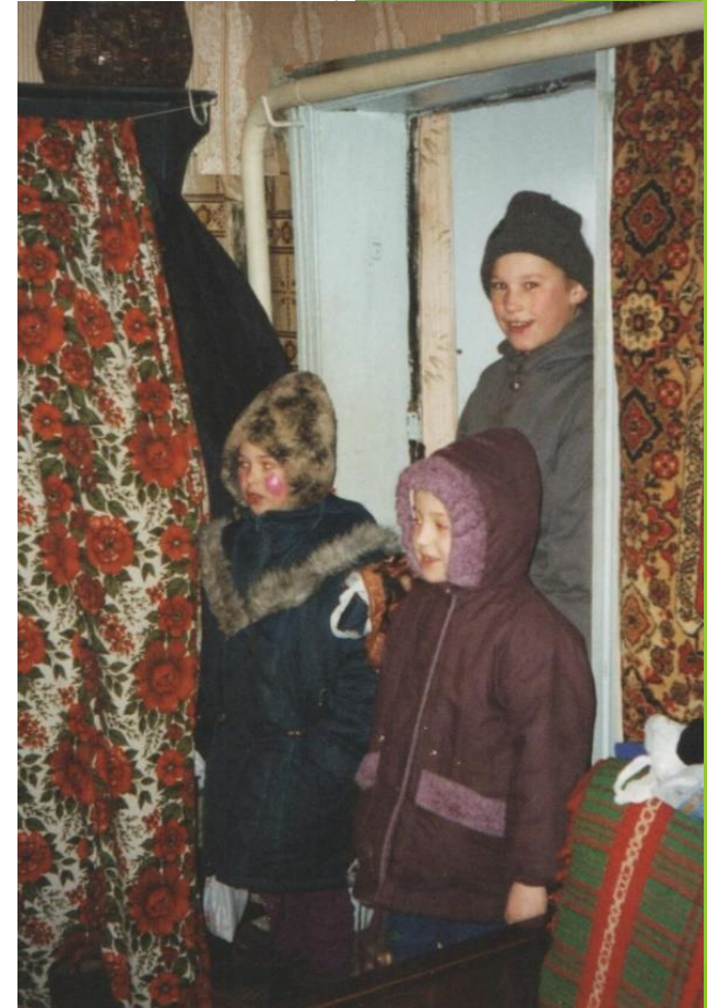
Свадебщики и дети-колядовщики в селе Большебыково Белгородской области