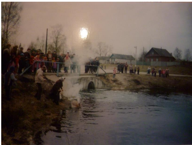
Возжигание и пускание по реке соломы при встрече весны. Брянская область