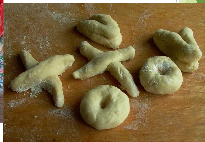
Святочное обрядовое печенье. Владимирская область