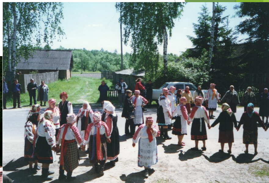
Круговые хороводы на Вознесение Брянская область