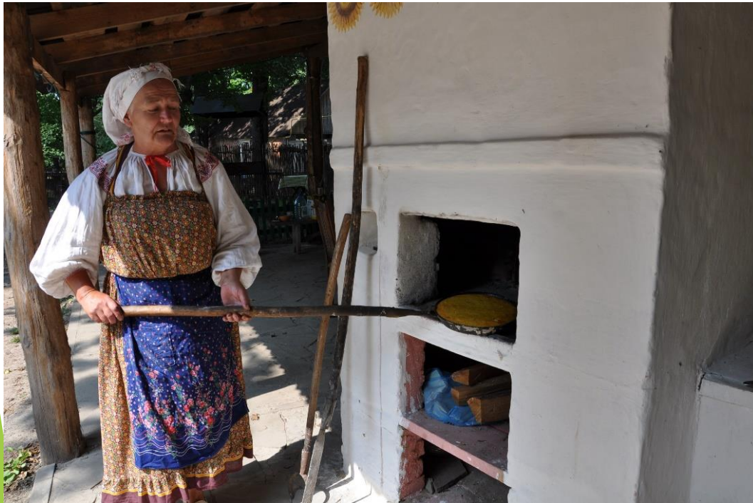
Выпечка каравая на кукушкины именины. Белгородская область