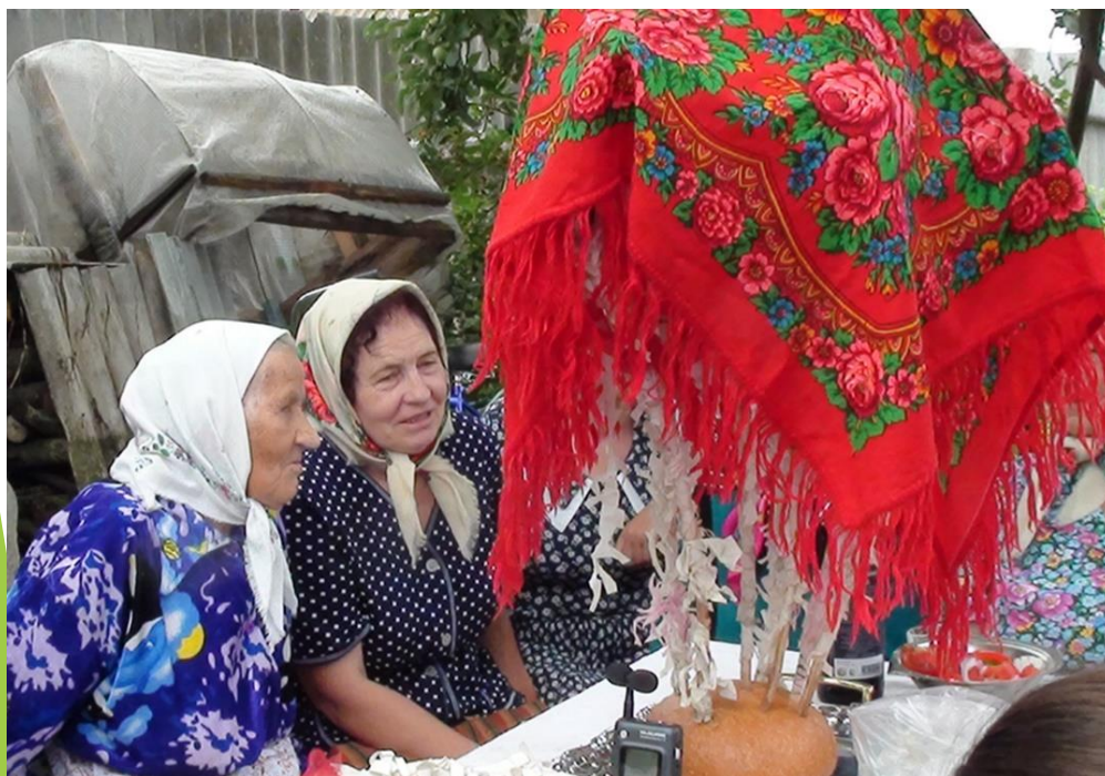
Свадебный каравай. Брянская область