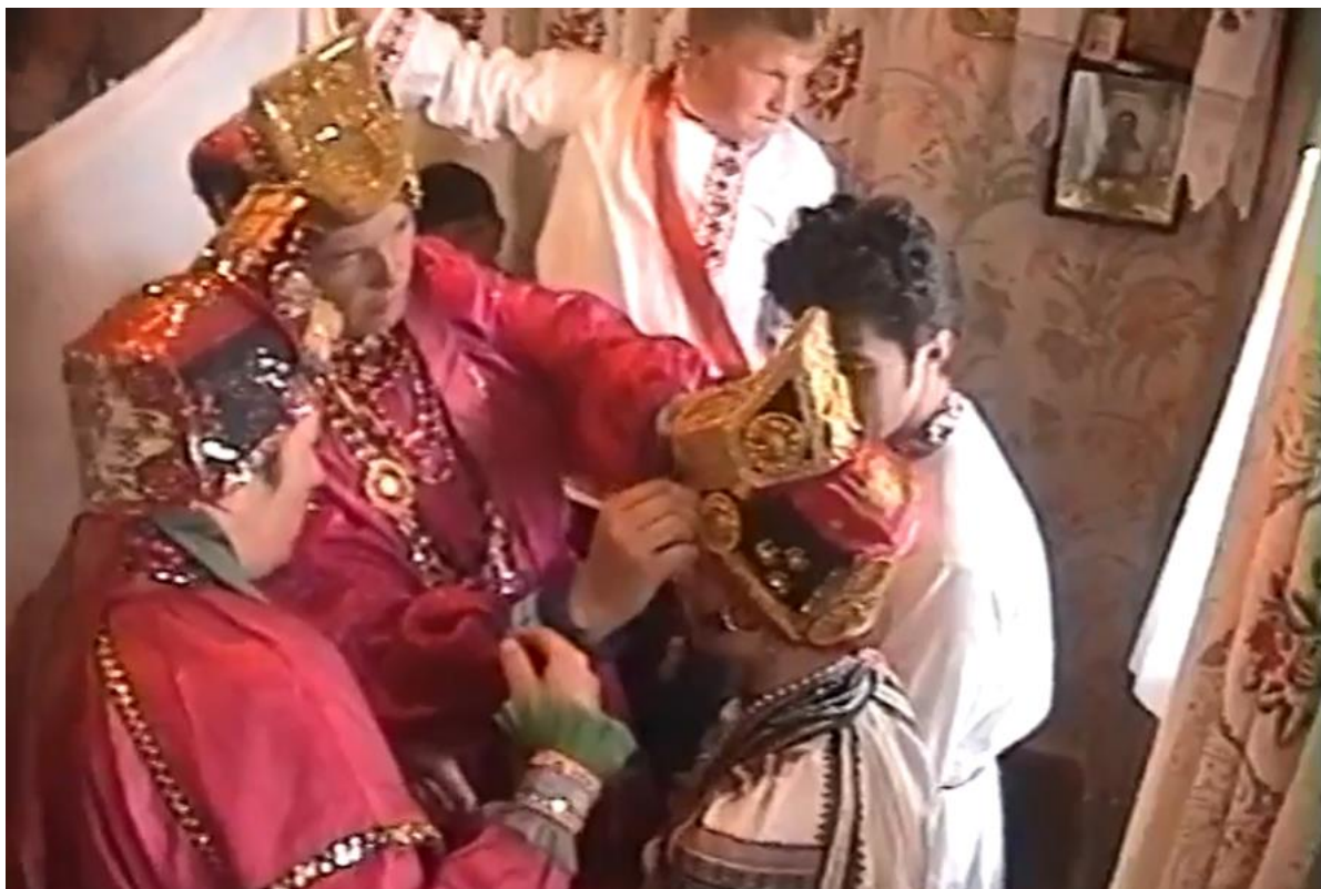
Повивание невесты. Свадьба в с. Большебыково Белгородской области