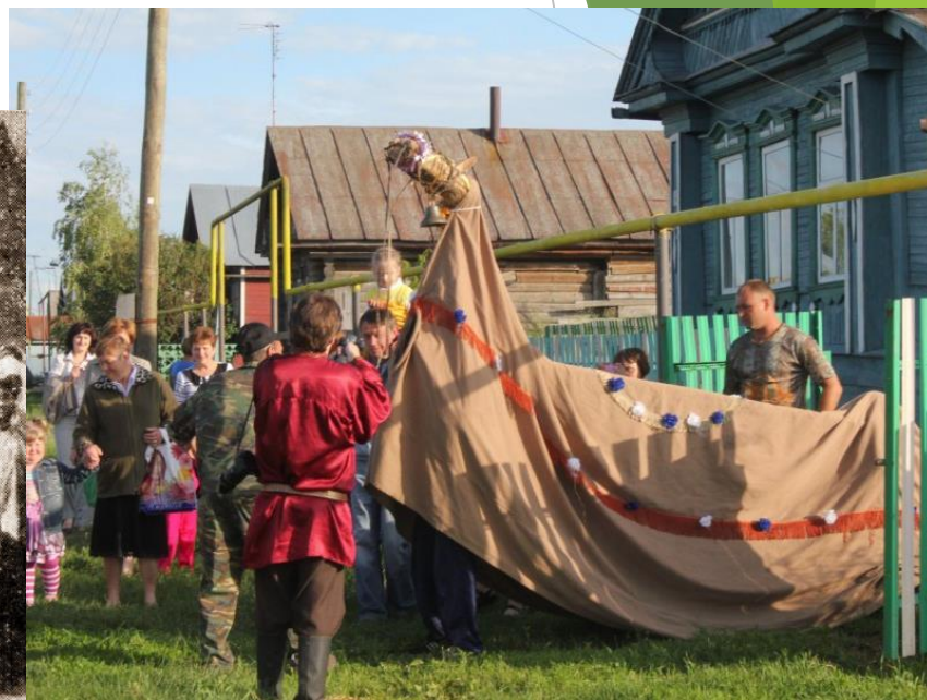
Вожделение русалки в селе Оськино Воронежской области 30-е годы XX века и XXI век