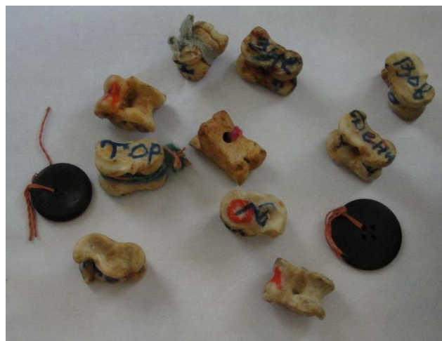
Предметы для гадания на Святки. Псковская область