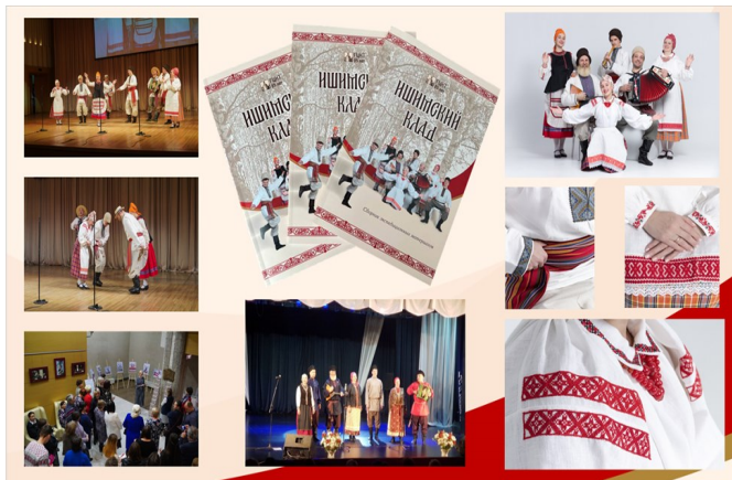
Проект «Поддержи традиции, край!»