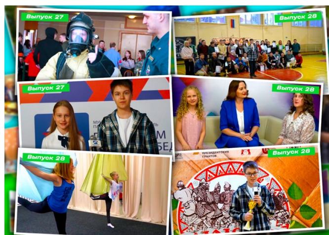
Проект «Недетские новости»