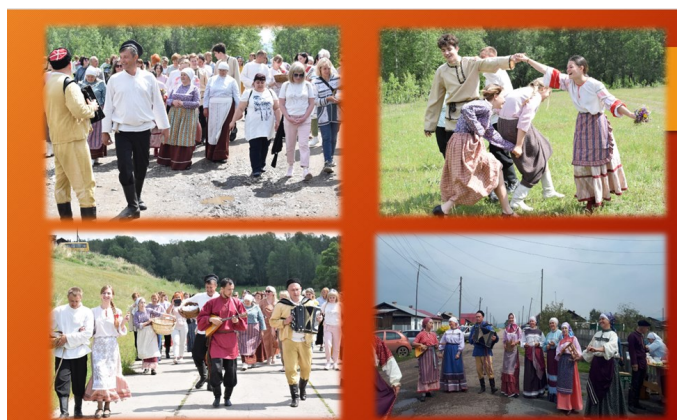
Проект «Дорога к храму»