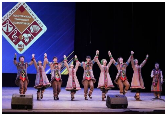
Народный самодеятельный коллектив Эвенкийский ансамбль песни и танца «Осиктакан»