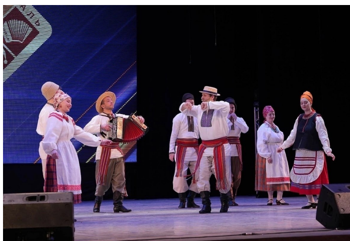
Ансамбль народной песни ГЦНТ «Сибирская веча́ра»

Желаем коллективам дальнейших творческих успехов!