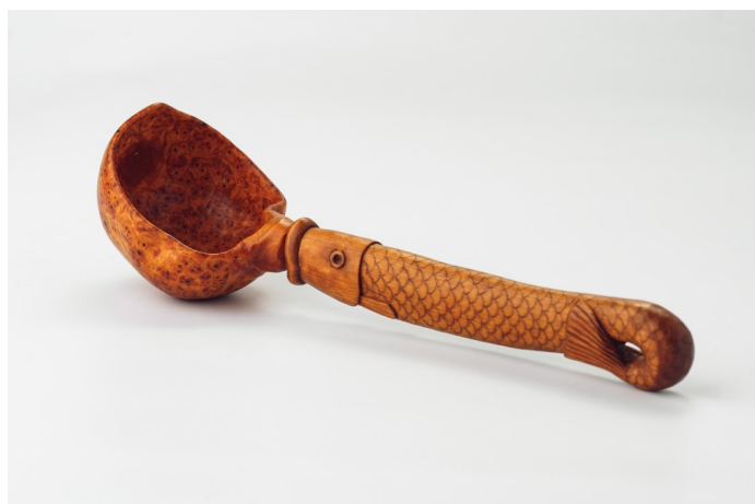
Кошельков А.И. Ковш «Рыба»