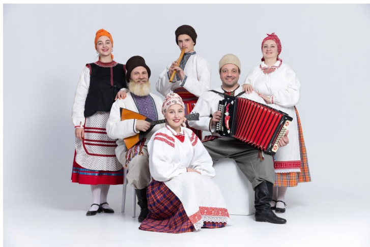
Ансамбль народной песни «Сибирская вечора»