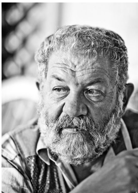
Анатолий Дмитриевич Силин режиссер-постановщик, лауреат Государственной премии СССР, заслуженный деятель искусств Российской Федерации

После того как вы увидели документы, которые существуют независимо от вас, начинает работать ваш талант сценариста и режиссёра.