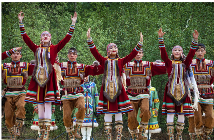
Народный самодеятельный коллектив Эвенкийский ансамбль песни и танца «Осиктакан»

Завершился первый этап Всероссийского фестиваля-конкурса любительских творческих коллективов, в котором приняли участие 278 коллективов – народно-певческие, фольклорные, танцевальные коллективы и оркестры народных инструментов. Впервые в конкурсе приняли участие и новые регионы России: заявки подали коллективы Луганской и Донецкой народных республик, Херсонской области. Жюри определило 60 коллективов, которые прошли в следующий этап и будут продолжать бороться за гранты национального проекта «Культура».