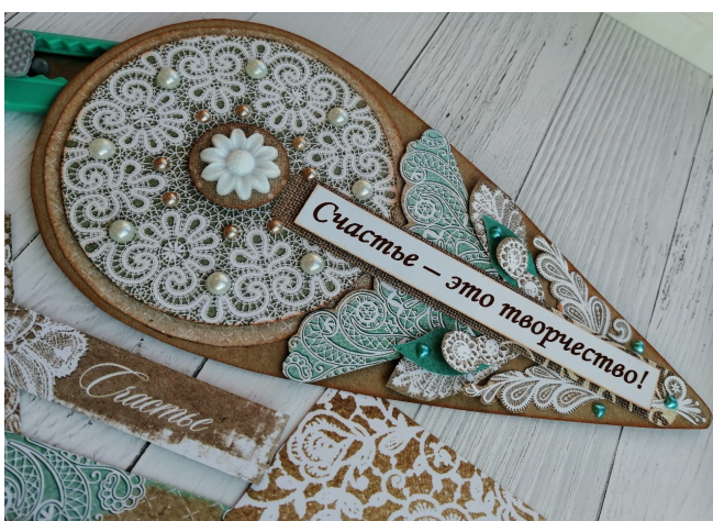
Работы студии «Радуга мастеров»