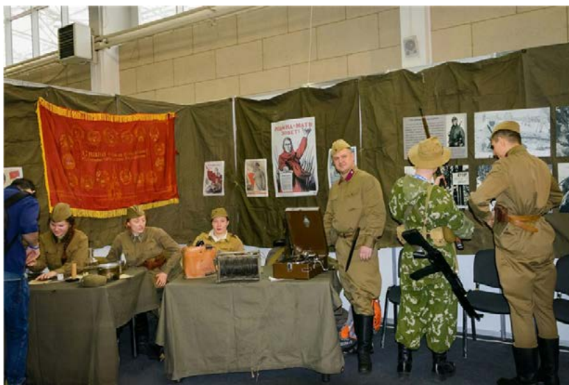
Фото 1. Площадка КОЛВИ на Российском патриотическом фестивале в МВДЦ «Сибирь», февраль 2016 г.

Среди наиболее успешных форм взаимодействия с учреждениями культуры можно выделить акции памяти, проводимые членами КРОО КОЛВИ совместно с сотрудниками красноярских музеев (Красноярский краевой краеведческий музей, музей «Мемориал Победы»), библиотек (Государственная универсальная научная библиотека Красноярского края, Централизованная библиотечная система взрослого населения имени А. М. Горького и др.).