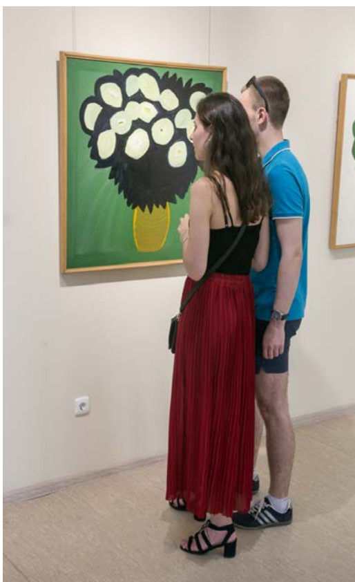
Фото 15. На выставке «Матисс. Поздеев. Цветы». Экспозиционно-выставочный зал Культурно-исторического центра

Андрея Поздеева», прошедшая в рамках праздника «Сибирский первоцвет». На выставке были представлены произведения искусства известных художников: французского художника Анри Матисса и красноярского художника Андрея Геннадьевича Поздеева. Общественная организация «Фонд Андрея Поздеева» многие годы активно сотрудничает с учреждениями культуры на территории Красноярского края как на контрактной, так и на безвозмездной основе.