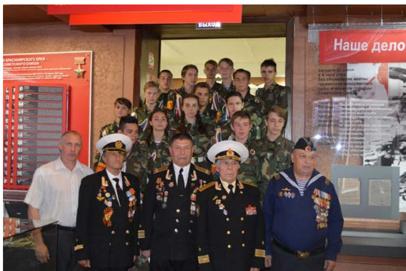
Фото 4. Участие ветеранов Военно-морского флота в праздничных мероприятиях на территории музея «Мемориал Победы»

ных познавательных проектов для школьников. Формы работы с ветеранами разнообразны: встречи и беседы ветеранов с молодежью, творческие встречи, вечера воспоминаний, торжественные мероприятия в Дни воинской славы, акции, выставки. Перечисленное являет собой традиционные формы работы для музея «Мемориал Победы». Особое внимание уделяется отдельным событиям военной истории, юбилейным датам. Например, к 100-летию Пограничных войск России была организована выставка, к 75-летию обороны порта Диксон в музее прошла акция памяти в честь погибших моряков.