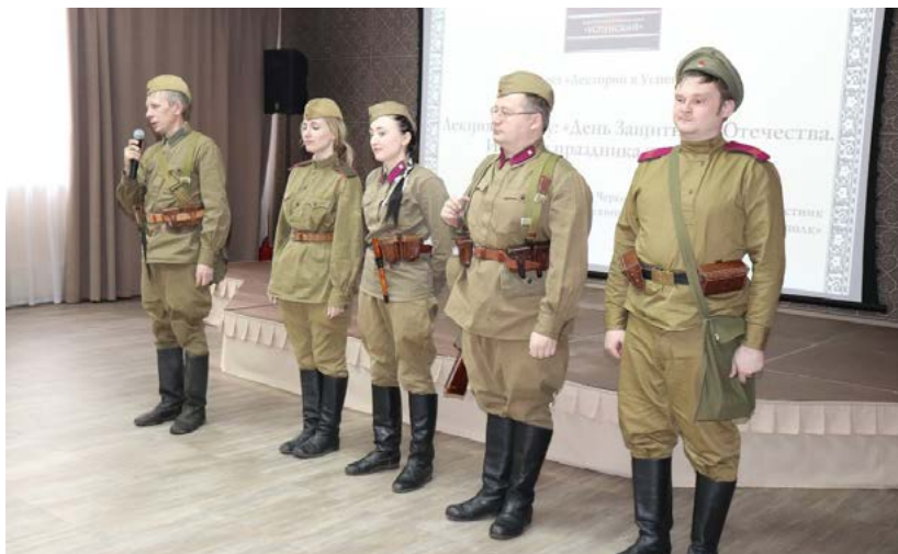
Фото 3. Участие КОЛВИ в Дне открытых дверей «День защитника Отечества», Культурно-исторический центр, февраль 2018 г.

Также ярким примером взаимодействия в сфере патриотического воспитания молодежи является сотрудничество на контрактной основе КРОО КОЛВИ со структурным подразделением ГЦНТ — Культурно-историческим центром. Обладая значительной материально-технической базой, включающей в себя подлинные предметы униформы, вооружения и снаряжения, КРОО КОЛВИ неоднократно организовывало в Культурно-историческом центре выставки по военно-исторической тематике, фото-локации, интерактивные площадки для детей и подростков.