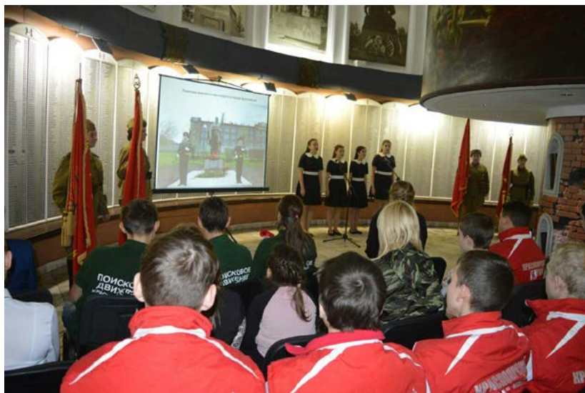
Фото 2. Мастер-класс для начинающих поисковиков по солдатской форме и снаряжению времен Великой Отечественной войны 1941—1945 гг., музей «Мемориал Победы», февраль 2018 г.

В качестве примера можно рассмотреть акции памяти, прошедшие в июне 2016, 2017, 2018 годов в разных местах г. Красноярска, связанных с историей участия красноярцев в Великой Отечественной войне 1941—1945 гг. Так, 22 июня 2016 года члены Красноярского общества любителей военной истории стали соорганизаторами и участниками торжественного заложения капсулы с землей, доставленной из мест захоронений павших в боях Великой Отечественной войны воинов-красноярцев под мемориалом пропавшим без вести солдатам. 22 июня 2017—2018 годов обмундированные в точные реплики униформы и снаряжения Рабоче-крестьянской Красной Армии начального периода войны, члены КРОО КОЛВИ стали соучастниками и соорганизаторами акции памяти на территории мемориального комплекса Поклонной горы г. Красноярска, создав уникальную историческую атмосферу во время памятных церемоний.