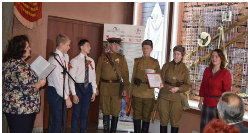
Фото 8. Вручение благодарственных писем волонтерам музея и членам КРОО «Красноярское общество любителей военной истории» на территории музея «Мемориал Победы»

Важным субъектом в сфере патриотического воспитания молодежи, помимо объединённой в организации активной общественности, могут стать и уникальные активисты. Для нас таким примером являются музейные волонтеры. Для реализации многих наших проектов требуется привлечение дополнительных партнеров (соорганизаторов), в этом случае волонтеры являются для нас большими помощниками.