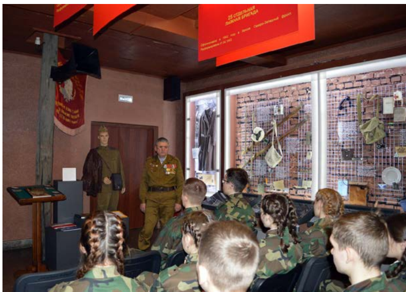
Фото 6. «Урок мужества» для школьников старших классов на территории музея «Мемориал Победы»

Перспективной формой работы ветеранских организаций в деле патриотического воспитания молодежи является кураторство их участниками военно-патриотических клубов и объединений, действующих на базе учреждений культуры.