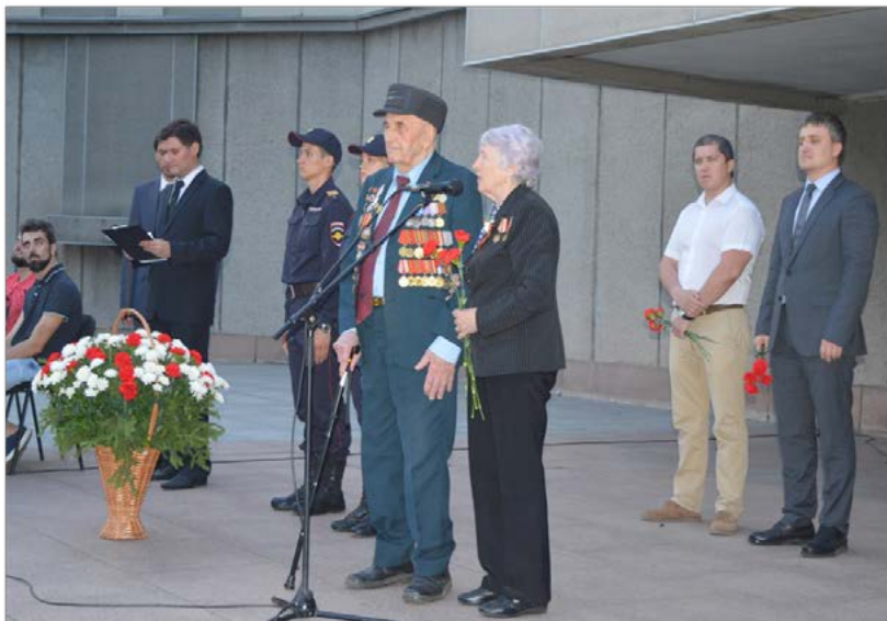
Фото 5. Участие ветеранов Великой Отечественной войны 1941—1945 гг. в праздничных мероприятиях на территории музея «Мемориал Победы»

на одной площадке различных людей, являющихся источниками исторической информации, позволяет наиболее полно раскрыть тот или иной исторический аспект.