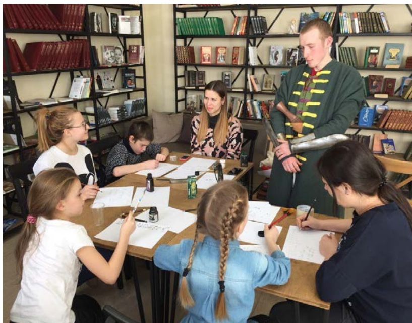
Фото 17. Мастер-класс по церковнославянской письменности в читальном зале информационно-ресурсного отдела Культурно-исторического центра

ной основе открытые мастер-классы по церковнославянской письменности для всех желающих.