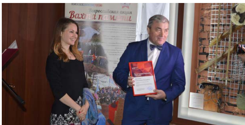
Фото 7. Торжественное мероприятие в рамках красноярской акции «Вахта памяти» на территории музея «Мемориал Победы»

ноярске проходит открытие «Вахты памяти», в которой принимают участие десятки школьников в возрасте 14—18 лет. Традиционным стало участие поисковиков в организуемой ежегодно музеем программе «Весна Победы», включающей в себя выставки, дискуссионные площадки, игры, квесты, мастер-классы, тематические экскурсии.