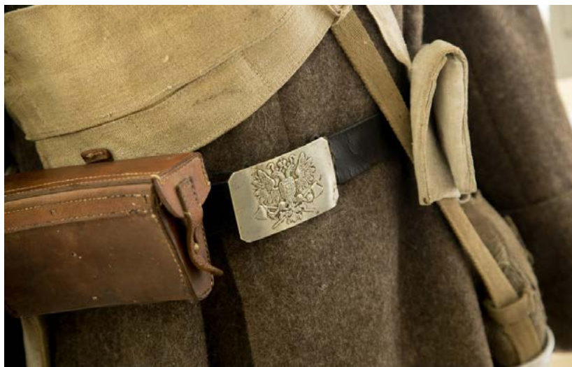
Фото 13. Подлинные предметы снаряжения пехотинца Русской Императорской Армии периода 1914—1918 гг. на выставке «Забывтая война — Брусиловский прорыв» (из частной коллекции членов Красноярского общества любителей военной истории). Экспозиционно-выставочный зал Культурно-исторического центра

сии в Первой мировой войне 1914—1918 гг. Благодаря активному содействию членов Красноярского общества любителей военной истории были представлены уникальные как для г. Красноярска, так и для всего сибирского региона материалы — исторические артефакты, документы, почтовые открытки, авиамодели. Хронике тех лет помогли восстановить личные вещи участников войны и военные трофеи, униформа и снаряжение Русской императорской армии периода Первой мировой войны. Все исторические артефакты являлись личной собственностью членов Красноярского общества любителей военной истории и представлялись широкой публике впервые.