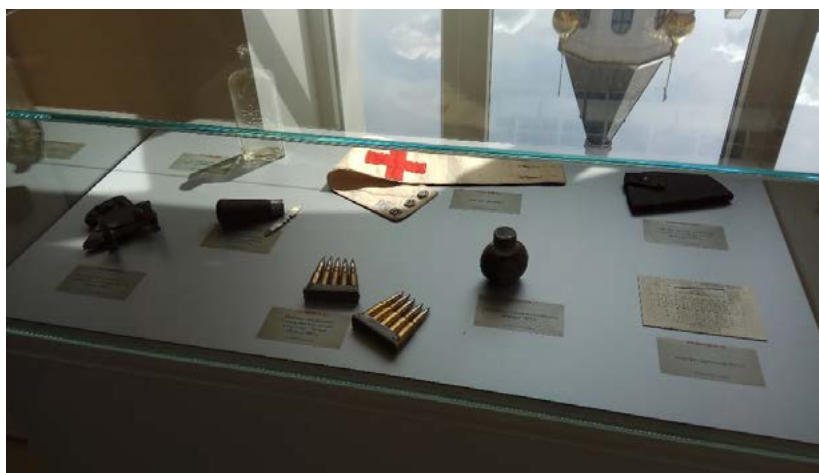
Фото 14. Подлинные предметы снаряжения и быта Русской императорской армии периода 1914—1918 гг. на выставке «Забывтая война — Брусиловский прорыв» (из частной коллекции членов Красноярского общества любителей военной истории). Экспозиционно-выставочный зал Культурно-исторического центра

приятия, где помимо предмета соглашения указывались права и обязанности сторон, условия приема-передачи экспонатов, сроки проведения, ответственность сторон и сроки действия соглашения. Специалистами Культурно-исторического центра были подготовлены акты приема-передачи экспонатов с подробным описанием каждого из них (несмотря на то, что предметы долгое время находились в частных коллекциях, они не имели описания).