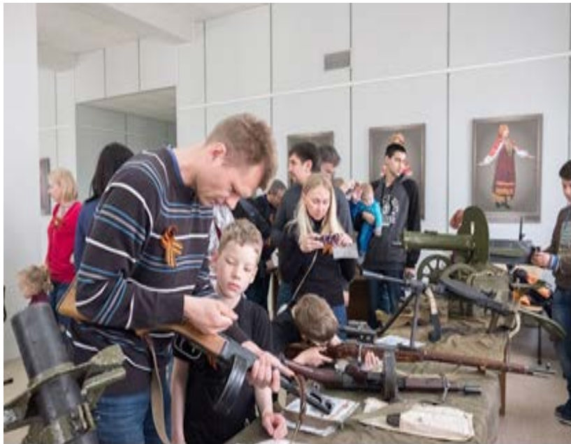
Фото 18. Интерактивная локация «Вооружение Красной Армии». День открытых дверей в Культурно-историческом центре

война», «Вторая мировая война». Каждый посетитель смог сделать памятную фотографию, ознакомиться с униформой и вооружением русской армии различных исторических периодов.