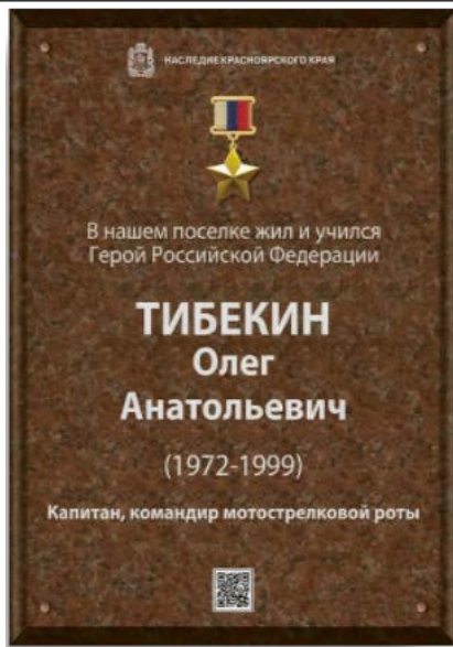
Фото 12. Проект мемориальной таблички Герою Российской Федерации Тибекину Олегу Анатольевичу, впоследствии установленной в поселке Северо-Енисейском Красноярского края